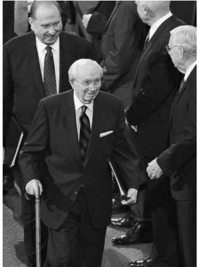
Präsident Gordon B. Hinckley und Präsident Thomas S. Monson von der Ersten Präsidentschaft verlassen das Podium.